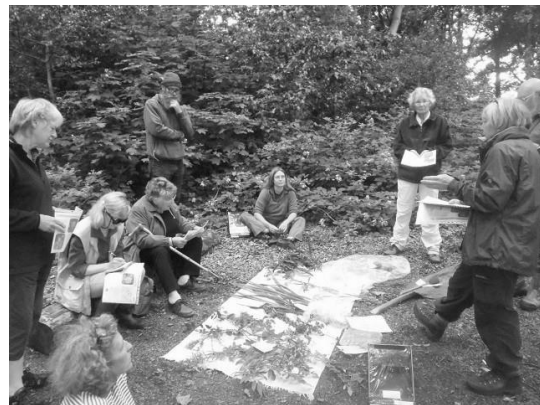
Diwrnod tacllo planhigion ymledol