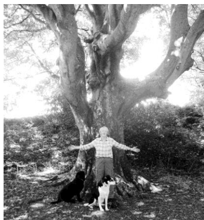
Fy ngwraig ac hen coeden

Cier syniad bras o oedran coeden fyw o'i gylchedd mesur 1.3, wedi'i fesuru metr i fyny o ei sylfaen, ei