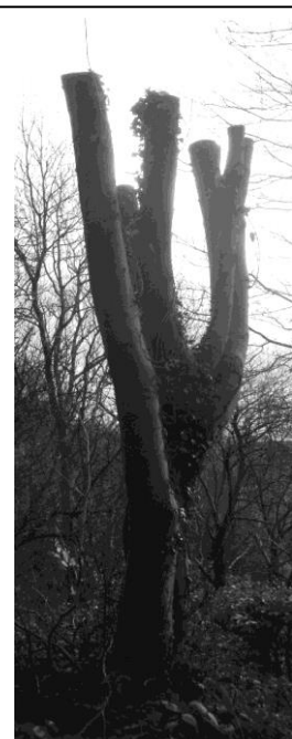
Coeden a gafodd ei gwtogi