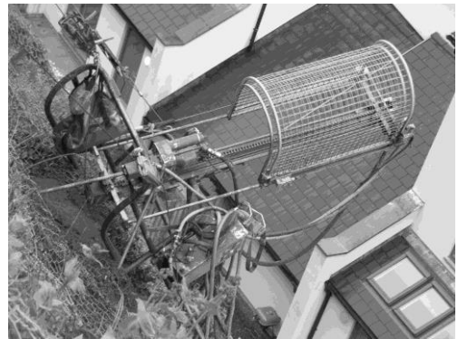
Drilio Clawdd Worgate

Mae rhai o'r madfallod a nadroedd defaid yn ifanc felly mae'n ymddangos bod y ddwy rywogaeth yn cael eu bridio yn y Parc. Wrth gwrs, mae'n bosib ein bod yn cofnodi'r un anifail ar sawl achlysur. Fodd bynnag gwelwyd 7 neidr defaid ar un diwrnod felly rydym yn gwybod mae o leiaf 7 unigolyn yn bresennol.