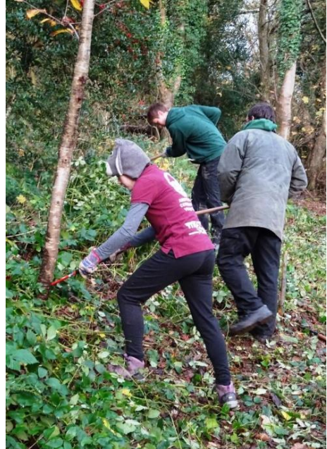
Gwirfoddolwyr Cadwraeth Aberystwyth yn clirio rhedyn ym mis Tachwedd

Mynediad i Bawb Yn dilyn y gwaith diweddar ar lwybrau i wella mynediad i Warchodfa Natur Pen Dinas, trafododd Pwyllgor Cefnogi'r PNP beth ellid gwneud i ganiatáu i bobl mewn cadair olwynion neu sydd â phram i fwynhau'r Parc. Er nad yw llawer o'r llwybrau o fewn y Parc yn addas, wrth reswm, teimlwyd bod y llwybr o PJM neu fynediad Ffordd Penglais hyd at Lannerch y Ffawydd oedd y llwybr mwyaf addas. Byddai llawer o'r llwybr ar dir y Brifysgol; byddai angen eu cynnwys nhw mewn unrhyw ddatblygiadau o'r fath.