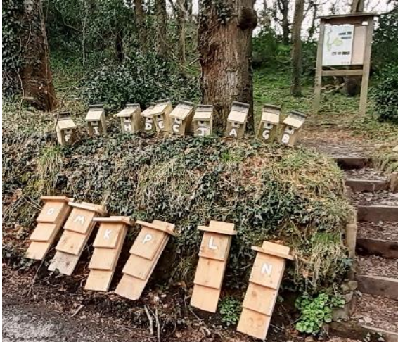
Blychau ystlumod (yn y blaen) a blychau nythu adar yn barod i'w gosod yng nghoedwig Bryn y Môr

Mae'r blychau ystlumod i ddyluniad cydnabyddedig ac fe'u hadeiladwyd o bren ffynidwydd douglas ( Douglas fir ) lleol heb ei drin. Adeiladwyd y blychau adar gyda thyllau eitha' mawr yn y gobaith o ddenu gwybedogion brith ( pie'd flycatchers ) i nythu ynddynt. Gosodwyd y blychau gan wynebu cyfeiriadau gwahanol ac mewn amgylcheddau amrywiol er mwyn rhoi dewis mawr i'r darpar denantiaid, er mae'n bosibl bydd rhai ohonynt yn canfod titw lleol yno yn barod.